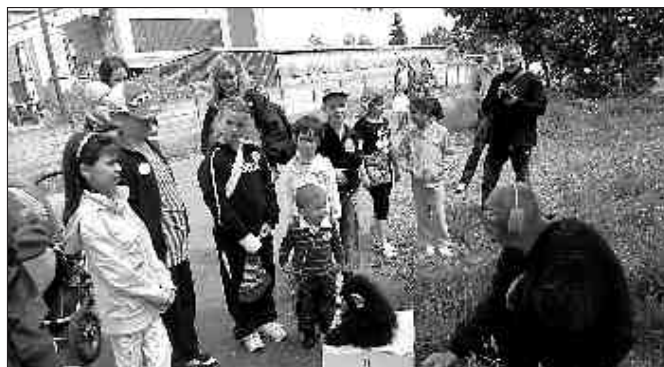
Pohádkový les, více na str. 5, 6