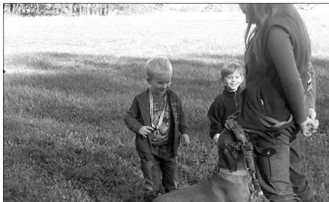
Ukázka loveckého výcviku