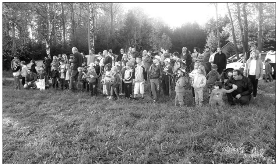
10. ročník Pomáháme zvířátkům