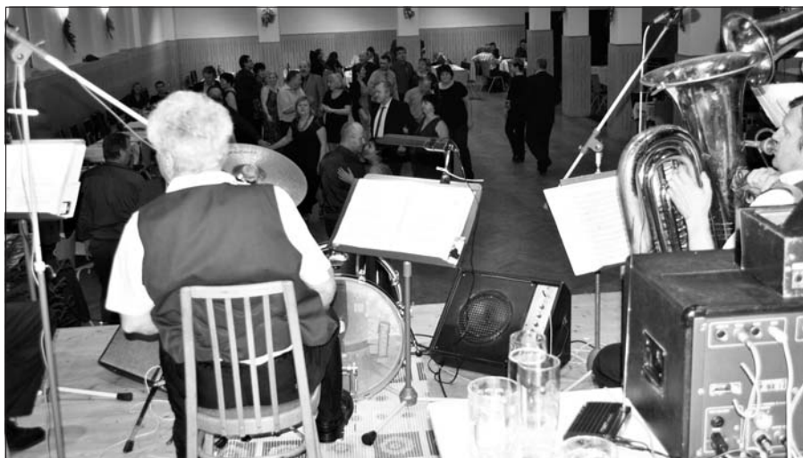
Kapela vytrvale hrála k radosti všech tančících návštěvníků