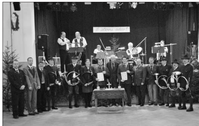
Společné foto se skupinou Flamendři a rakouskými trubači