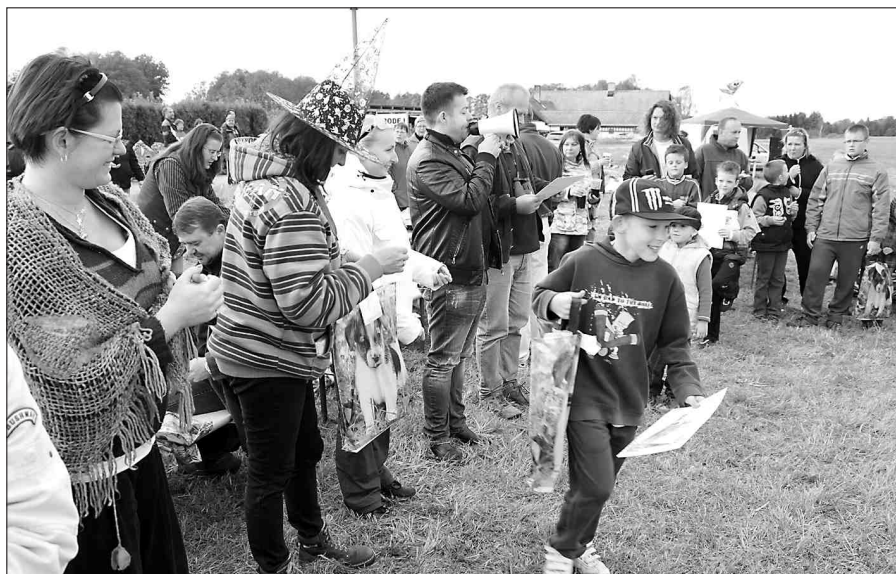
Drakiáda, více na str. 14