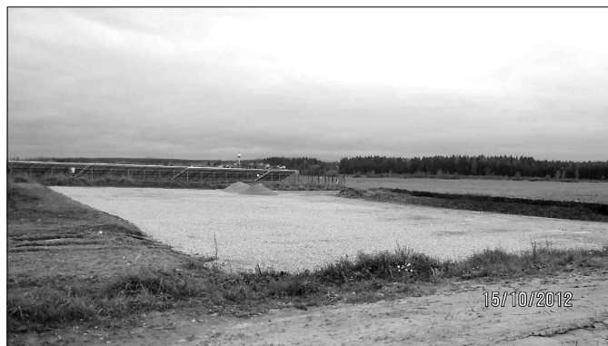
Kompostárna v areálu HP

Projekt komunitní kompostárny byl zpracován v polovině roku 2011, navrhované zařízení bylo navrženo zhruba pro 3.500 obyvatel. Bioodpad nebyl doposud cíleně tříděn pro další využití. Technické služby se starají o sečení pozemků ve vlastnictví města. Posečení a odvoz trávy provádějí soukromým vlastníkům na objednávku. Posečenou trávu a lupení ze stromů odváží technické služby na soukromý pozemek v Českých Velenicích. Dřevní hmota se odváží do areálu hospodářského parku, kde je teplárna spalující tyto odpady.