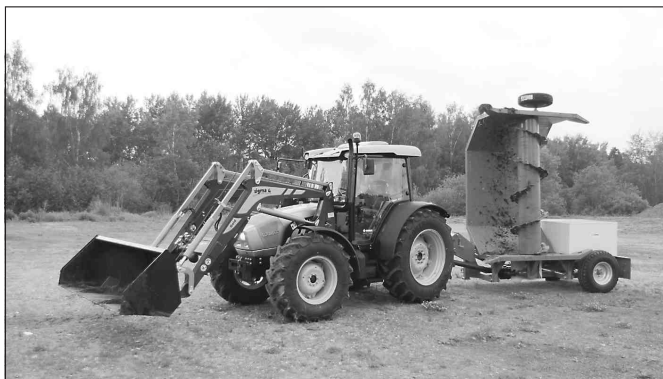
Traktor s čelním nakladačem a překopávačem

nemovitost a mají zaplacen poplatek za provoz systému shromažďování sběru, přepravy, třídění a odstraňování komunálních odpadů.