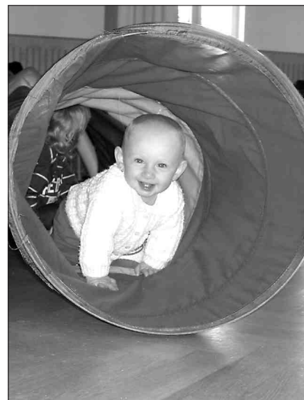
Z činnosti MK Piškůtek, více na str. 9