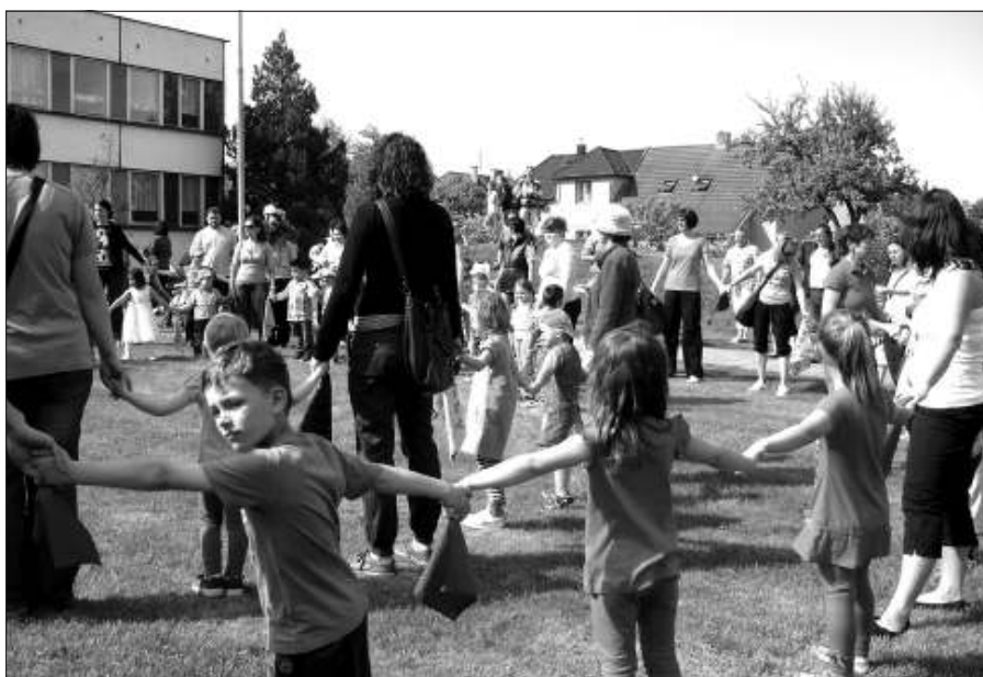
Svátek maminek - společné tanečky