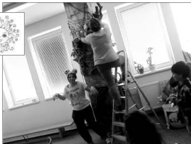
Jak jsme stavěli prales.