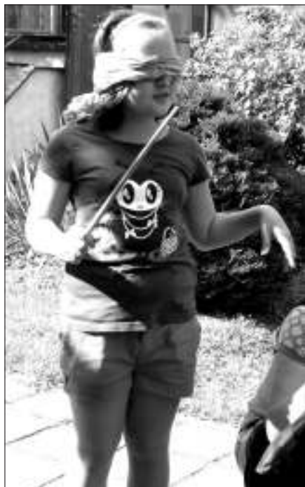
Kdo najde hrnec