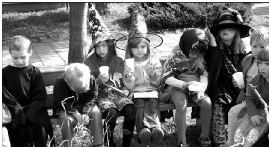
Buřtíčky čarodějnicím chutnaly