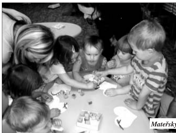
Mateřský klub Piškůtek