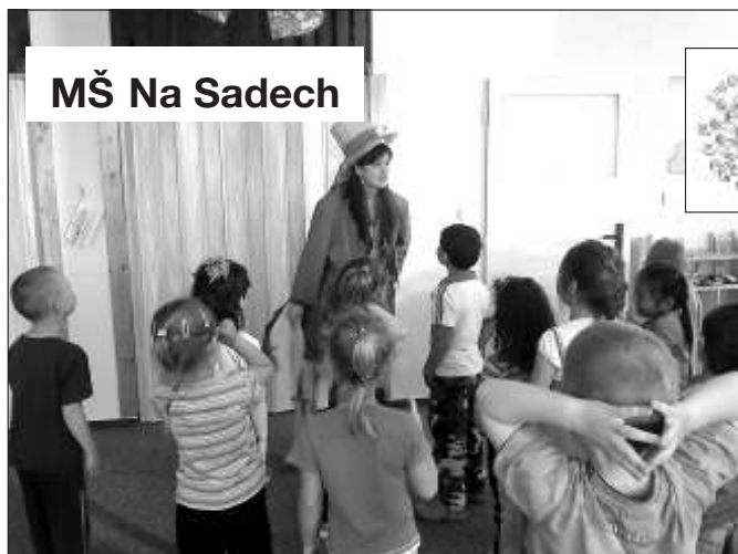
Děti si užily vodní a vodnické hry s praktikantkou.