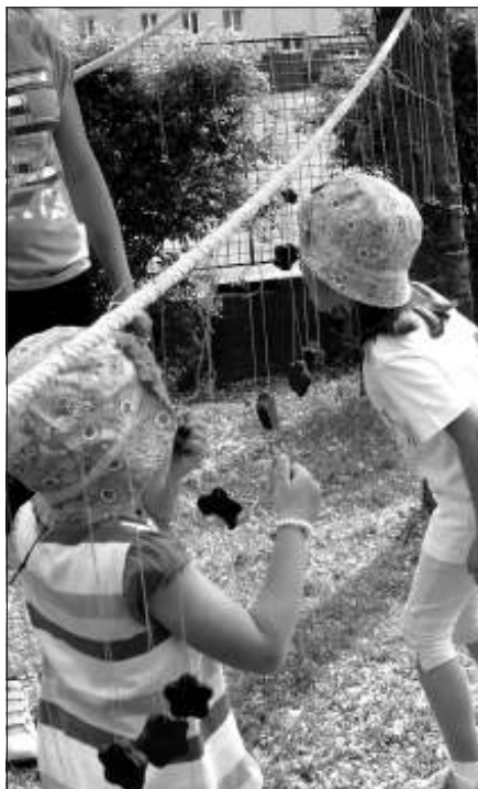
Kdo sní perníček