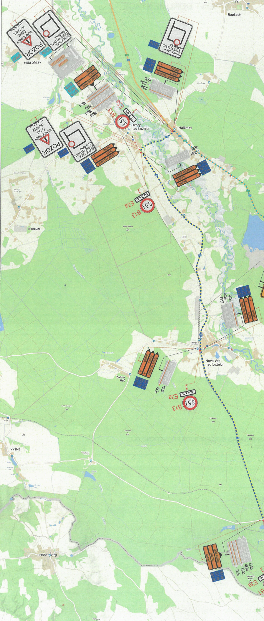
SITUACE DIO - OBJÍZDNÁ TRASA